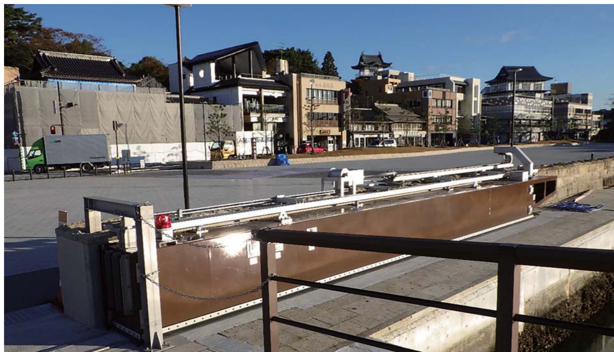
宮城県仙台塩釜港湾事務所 (9.00m×0.90m)