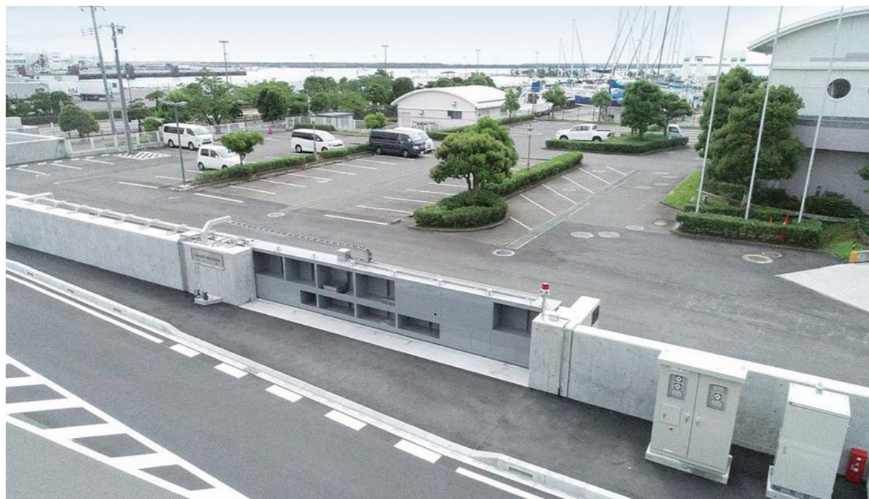
茨城県茨城港湾事務所大洗港区事業所 (10.0m×1.76m)