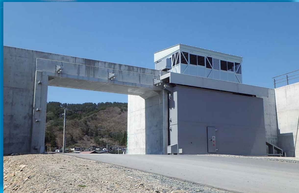
岩手県沿岸広域振興局 (8.00m×4.50m)