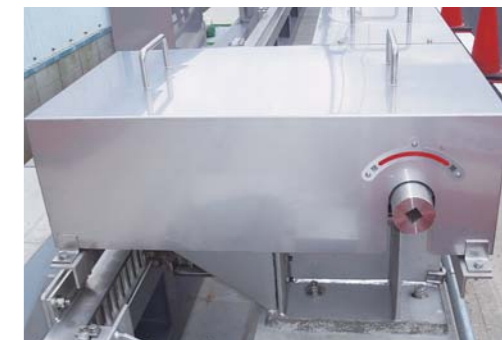
走行用ハンドル差込口