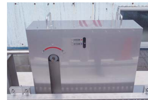
昇降用ハンドル差込口