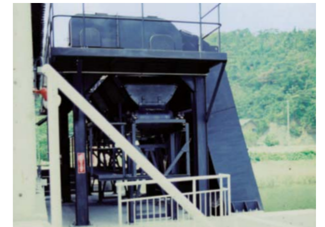
広島県竹原市役所