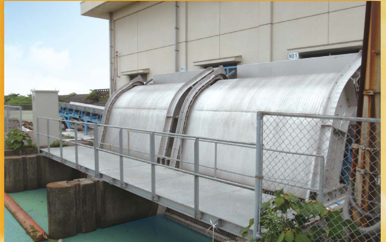
山口県岩国農林事務所 (4.05m×4.20m×2基)