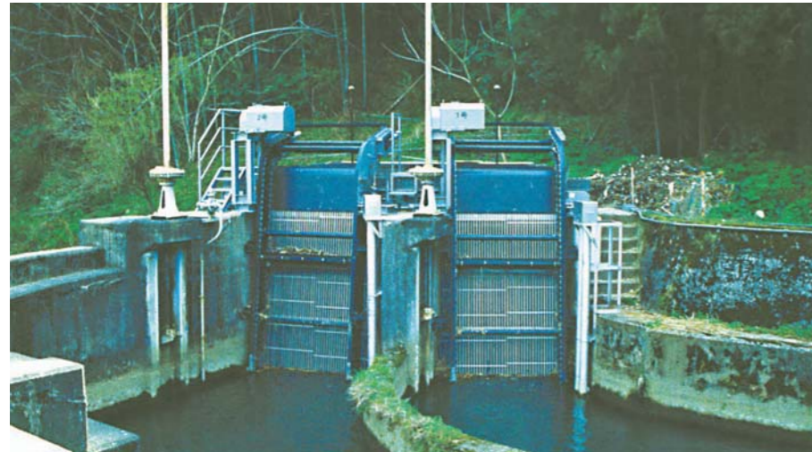
島根県企業局西部事務所