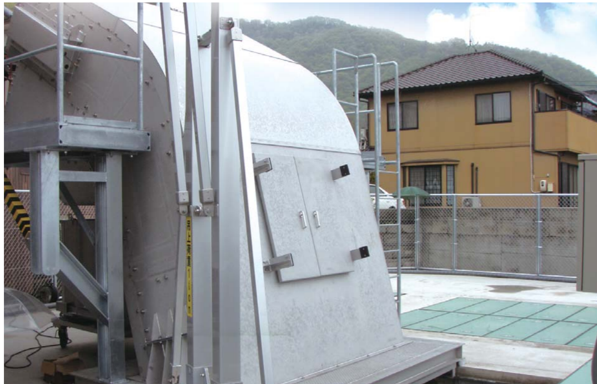
広島県三原市役所 (2.60m×1.95m)