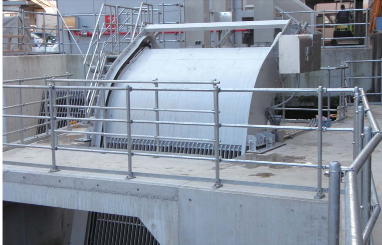
広島県府中町役場 (3.00m×3.17m)