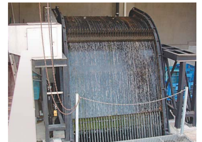
広島県尾道市役所