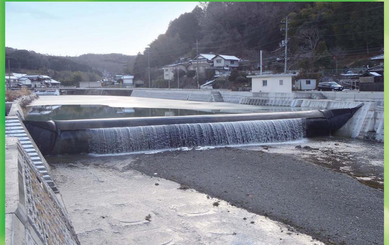
岡山県美作県民局 (W27.00m×H2.34m)