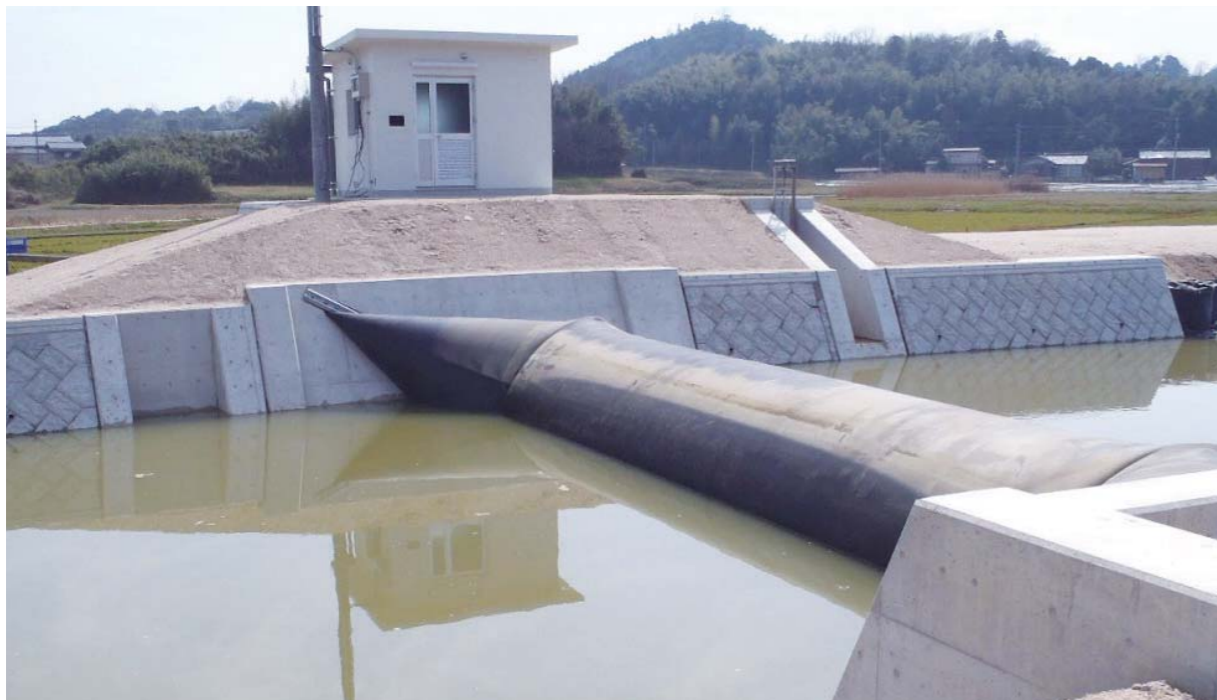
鳥取県西部総合事務所 (W11.00m×H2.10m)