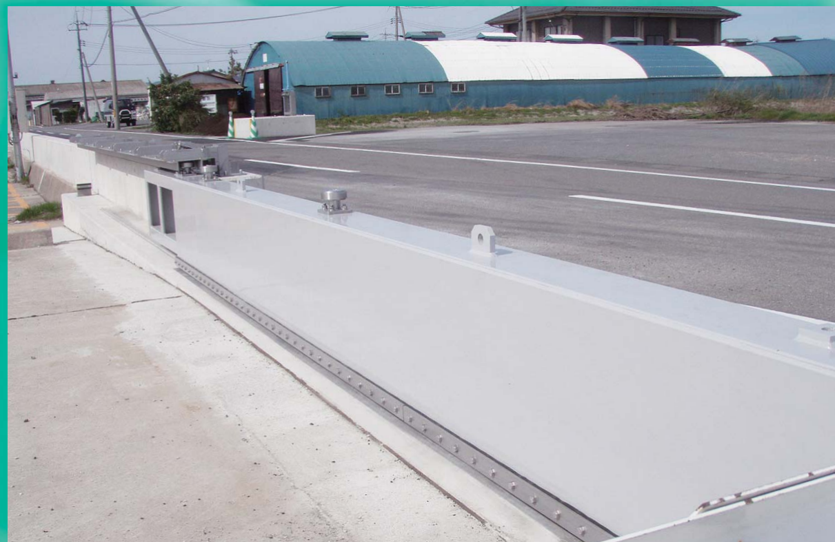
国土交通省出雲河川事務所（5.00m×0.54m）