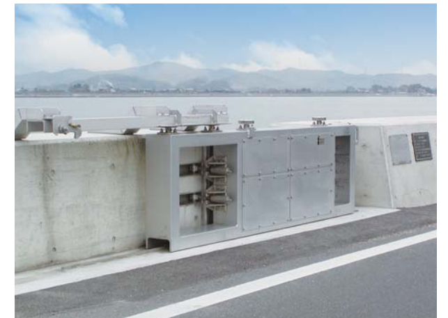
国土交通省 岡山河川事務所