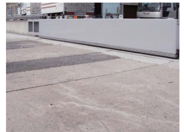
国土交通省 出雲河川事務所