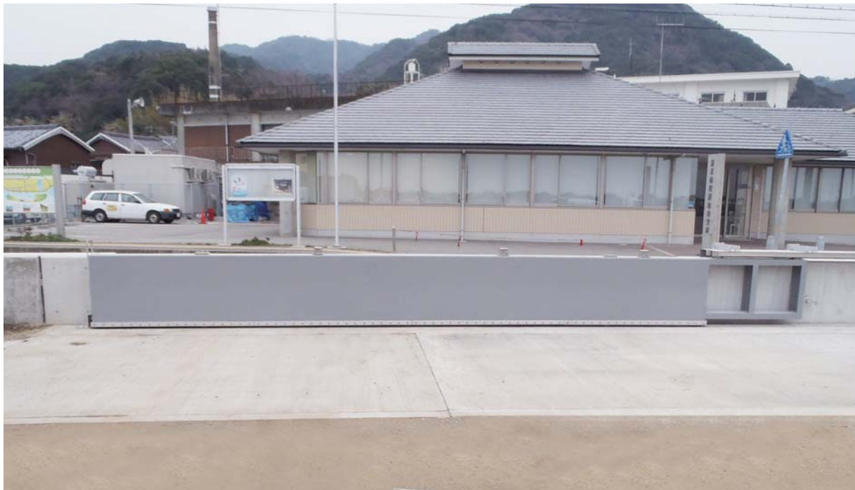
兵庫県淡路県民局（7.00m×0.80m）