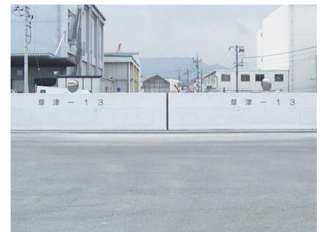
広島県広島港湾振興局