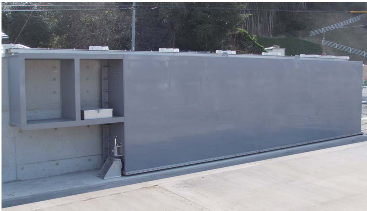
山口県柳井土木建築事務所（7.00m×1.98m）

※操作説明書にて、操作方法および注意事項を熟読の上、操作を行なってください。 ※ゲート走行操作を行なう時には、ゲート進行方向に人や障害物がないことを確認してください。 ※ゲート降下操作を行なう時には、けがをする恐れがありますのでゲートの下に指等を入れないでください。