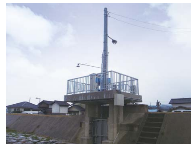
国土交通省 出雲河川事務所