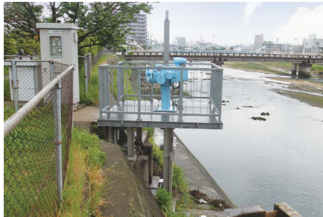
広島県西部建設事務所 (0.75m×1.25m)